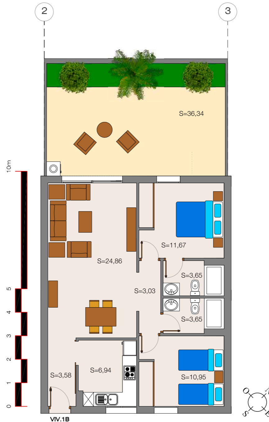
Cuadro de superficies de la vivienda en m 2