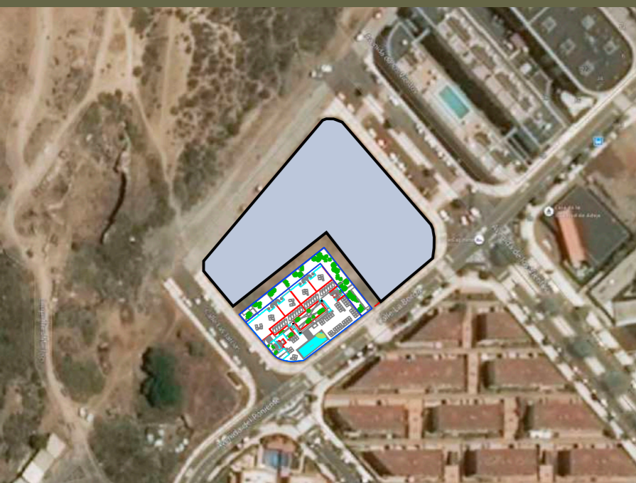
Vista aérea del emplazamiento