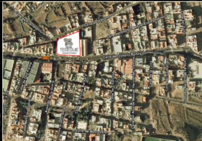
SITUACIÓN / EMPLAZAMIENTO