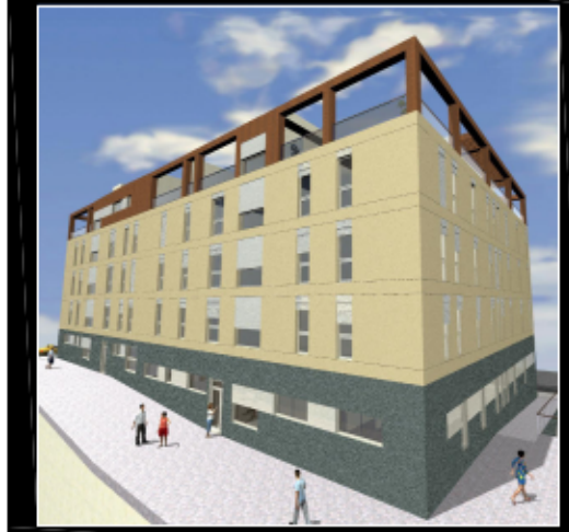
TIPOLOGIA | DORMITORIOS | PLANTA