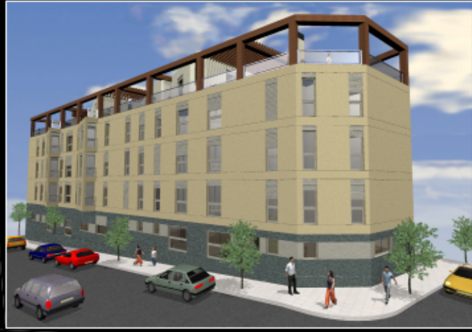
SITUACIÓN DE LA VIVIENDA